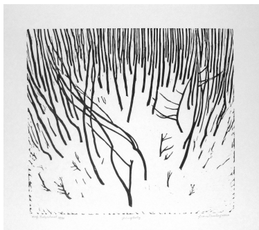
Fotocredit: Franz Traunfellner | Jungholz, Holzschnitt, 1964, 30 x 33 cm | © Bildrecht, Wien 2024