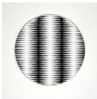
Christian Eder, Verticals on Circle, 2022, Acryl auf MDF, 75 x 75 cm