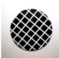
Christian Eder, Squares on Circle, 2023, Acryl auf MDF, 74 x 74 cm © Bildrecht, Wien 2024