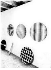
Christian Eder, Circles, Atlieransicht