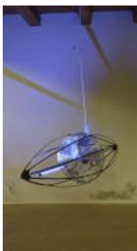
Christian Eder, Objekt, 2021, Holzspanten, Lack, LED-Licht, Rotor © Bildrecht, Wien 2024