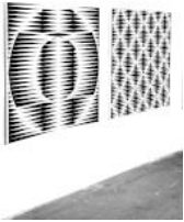
Christian Eder, Circle-Diagonales, Atlieransicht