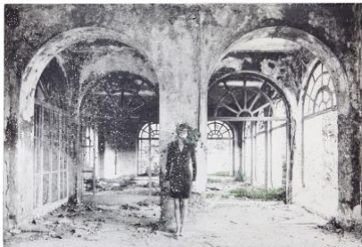
Fotocredit: Birgit Graschopf | Grand Hotel Nebenhalle, Fotografie auf Betonplatte, 40x60cm | © Bildrecht Wien 2020