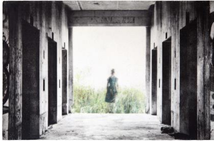
Fotocredit: Birgit Graschopf | Abandoned III, Fotografie auf Betonplatte 40x60cm | © Bildrecht Wien 2020

Die Abbildungen sind der E-Mail via Download-Link beigefügt und stehen unter Anführung der Fotocredits für Berichterstattung honorarfrei zur Verfügung.